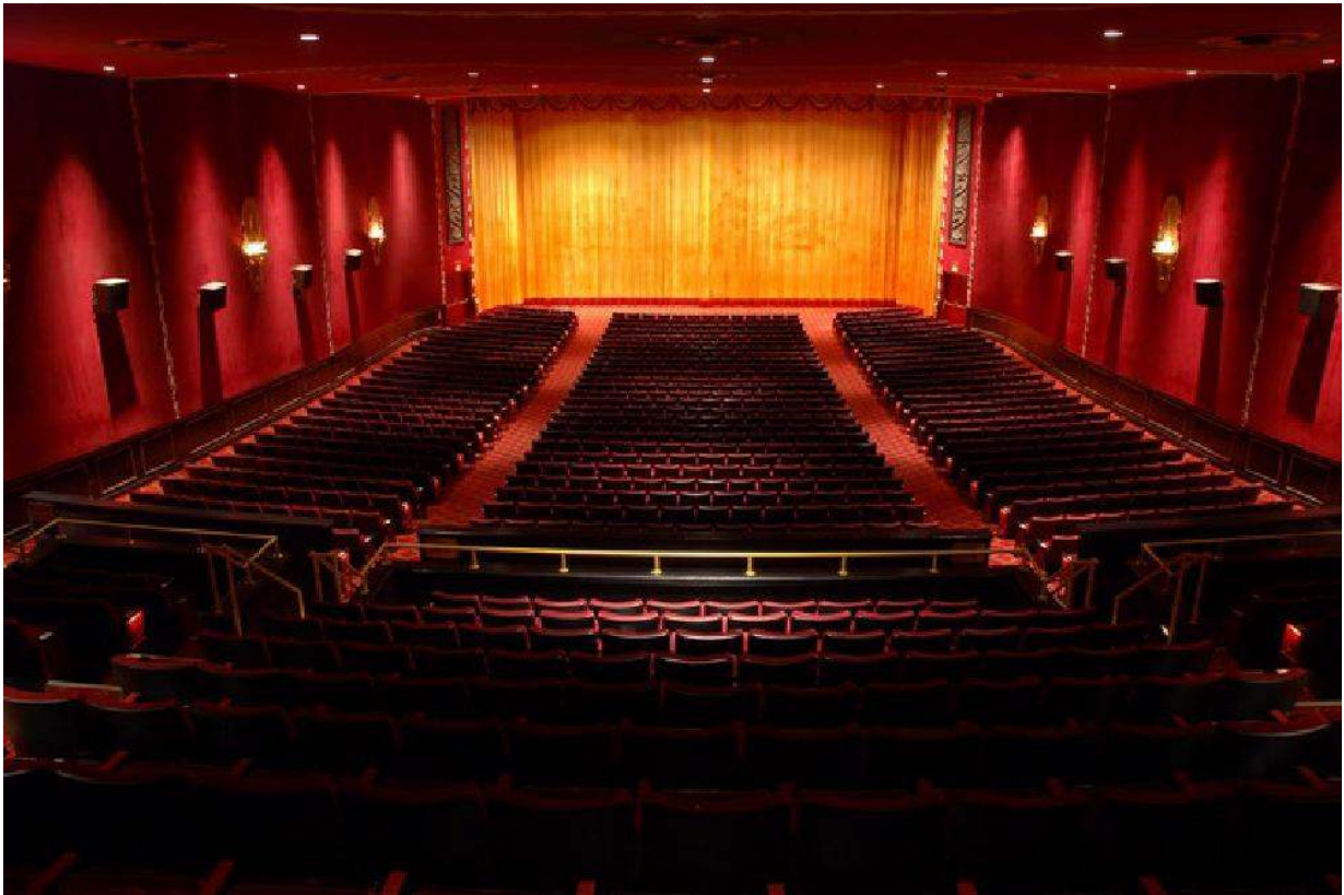
Kinosaal des Ziegfeld Theatre