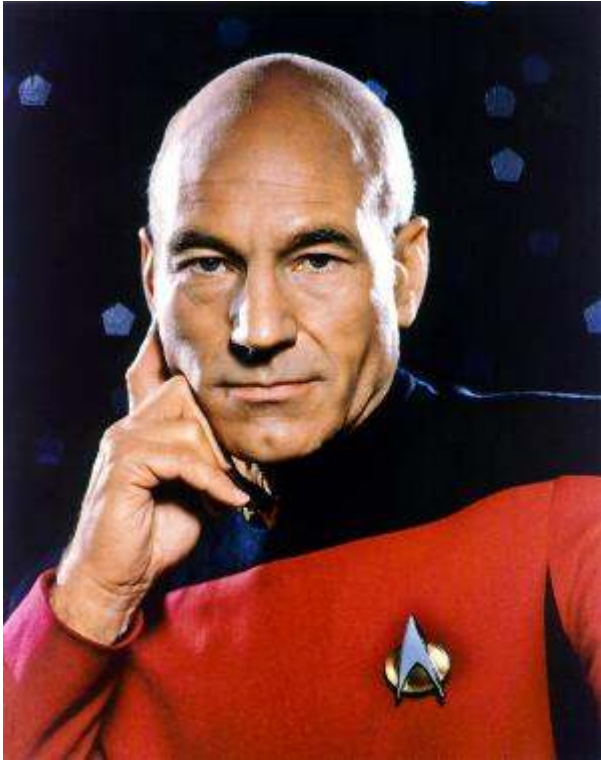
Jean-Luc Picard gespielt von Sir Patrick Stewart in der TV-Serie „The Next Generation“