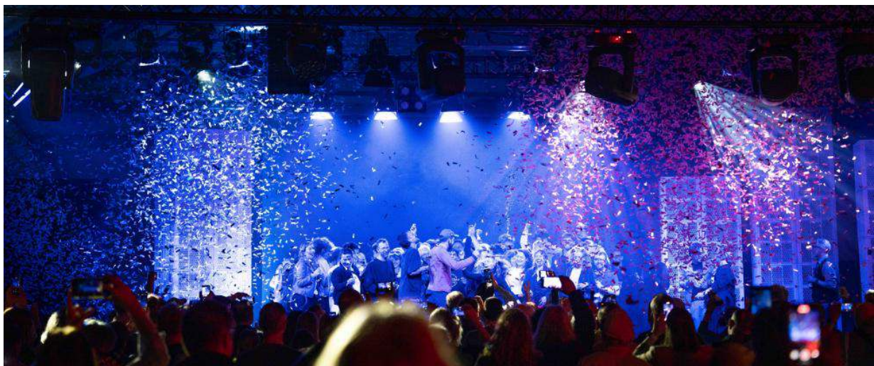
Ende gut, alles gut?