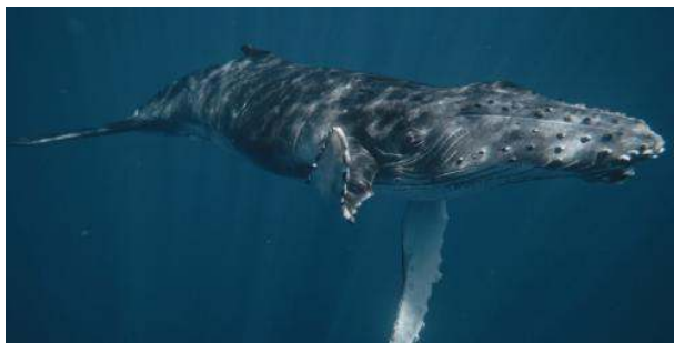
Buckelwal winkt uns zu