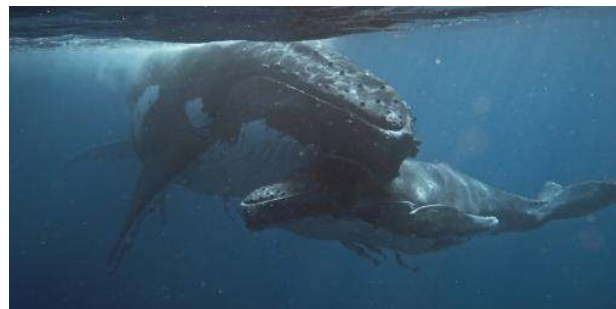
Buckelwalkuh und ihr Kalb kuscheln